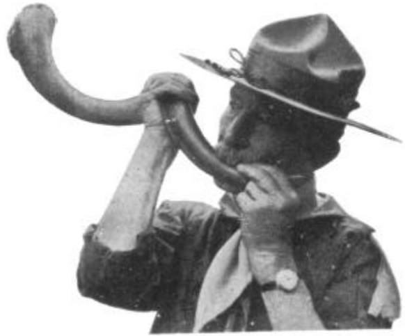
The Kudu Horn

El primer libro Guía se llamó: "Cómo las muchachas pueden ayudar a construir el Imperio". Fue escrito por la hermana del Jefe, quien tomó gran interés en el Movimiento Guía. Es un libro espléndido y todavía existen algunas copias. Contiene muchas ideas que son hoy en día tan útiles como lo fueron cuando fue escrito, hace muchos años. Pero "Escultismo para Muchachos" fue el primer gran libro, y cualquiera que trata de ser Guía o Scout sin él, va derecho al fracaso. Si leen cuidadosamente Escultismo para Muchachos, verán que el Jefe no inventó el Escultismo, sino que de las románticas y aventureras ideas del mundo y de sus grandes ideales, tomó todo aquello que con más seguridad ayudaría a un muchacho o muchacha, a un hombre o a una mujer, a caminar por la senda recta y a ser feliz.